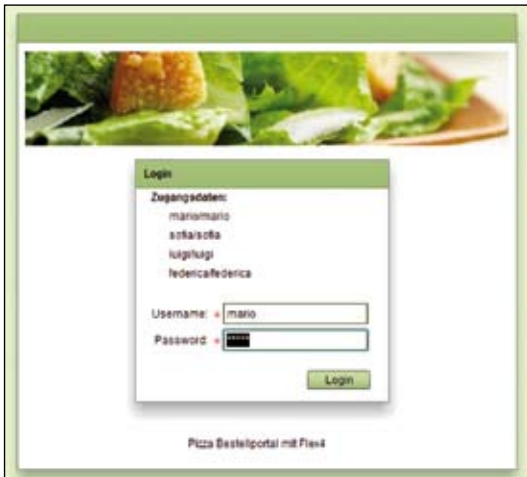
Abb. 3: Screenshot der gebauten Anwendung

geben, in dem die Testfälle abgelegt sind. Das reicht bereits aus, damit beim nächsten Build die sich in diesem Verzeichnis befindenden Testfälle automatisiert ausgeführt werden.